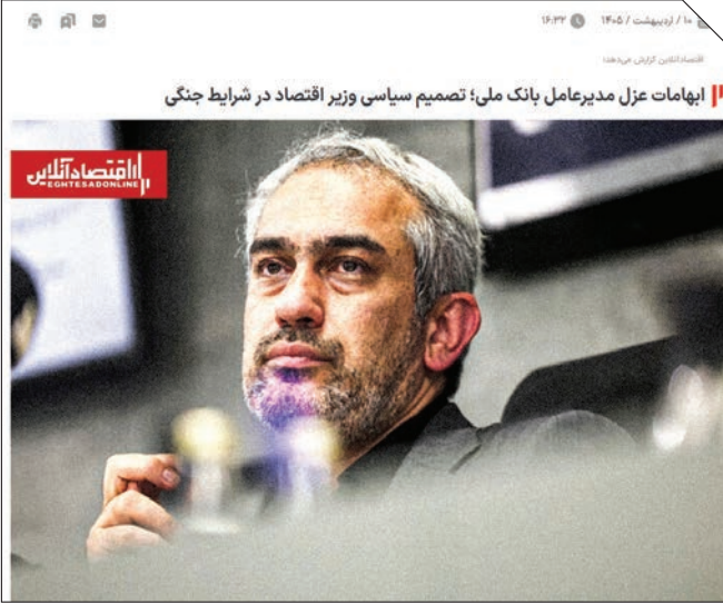
ابهامات عزل مدیرعامل بانک ملی؛ تصمیم سیاسی وزیر اقتصاد در شرایط جنگی