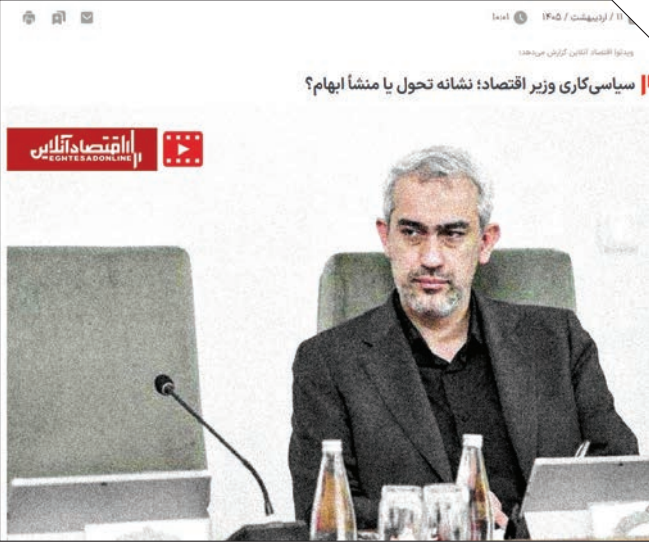
سیاسی کاری وزیر اقتصاد؛ نشانه تحول یا منشا ابهام؟

بر همین اساس، انتظار می رود کاهش رشد تولید صنعتی اروپا در این دوره محدودتر باشد، اما فشار بر کل بخش تولید، به ویژه صنایع صادرات محور، همچنان قابل توجه باقی بماند.