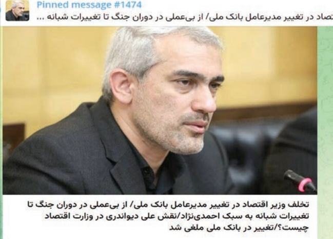
تغییر وزیر اقتصاد در تغییر مدیرعامل بانک ملی / از بی عملی در دوران جنگ تا تغییرات شبانه به سبک احمدی نژاد؛ نقش علی دیوانداری در وزارت اقتصاد چیست؟/ تغییر در بانک ملی ملغی شد