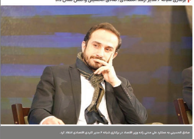
برگزاری شبانه ۶ مدیر ارشد اقتصادی / صادق الحسینی واکنش نشان داد