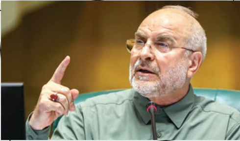
رئیس‌مجلس شورای اسلامی، علی‌اکبر قالیباف در جریان جلسه علنی مجلس شورای اسلامی