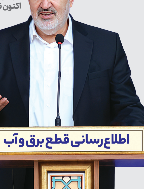
اطلاع‌رسانی قطع برق و آب

وزیر نیرو بعد از اعمال خاموشی‌ها در ماه‌های گذشته اکنون نسبت به قطع آب سخن گفته است