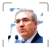
داوود منظور رئیس سابق سازمان برنامه و بودجه