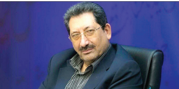
مکانیسم تسویه از طریق صندوق استراتژیک آفریقا و تخصیص ۲ میلیارد یورو تسهیلات در قالب

با این اوصاف باید عنوان کرد که نمایشگاه خودرو شانگهای ۲۰۲۵ بار دیگر ثابت کرد که صنعت خودروسازی جهانی در حال تحولات عظیمی است. از الکتریکی سازی گرفته تا ادغام فناوری های هوش مصنوعی و اینترنت اشیا. اما ایران، با وجود بیش از ۵۰ سال تجربه در تولید خودرو، همچنان در باتلاق فناوری های قدیمی مدیریت ناکارآمد و سیاست های انحصاری گرفتار است. کیفیت پایین محصولات، نبود رقابت، سیستم عرضه قرعه کشی و وابستگی به مونتاژ خودروهای رده پایین، صنعت خودروسازی ایران را به یک فاجعه تمام عیار تبدیل کرده است. بدون اصلاحات ساختاری، خصوصی سازی واقعی و سرمایه گذاری در تحقیق و توسعه، ایران نه تنها نمی تواند به بازگری در صحنه جهانی تبدیل شود، بلکه حتی در تأمین نیازهای داخلی نیز روز به روز ناکام تر خواهد شد. نمایشگاه شانگهای آینه ای بود که عقب ماندگی ایران را با وضوح دردناک به نمایش گذاشت، و این آینه، جزا اراده ای جدی برای تغییر، تصویری متفاوت نشان نخواهد داد.